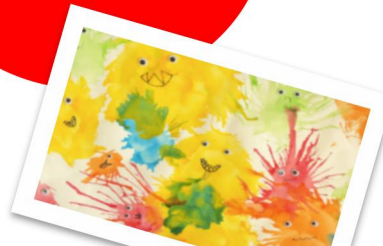
Eines der drei Siegerbilder aus dem Kreativwettbewerb